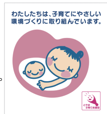
お出かけサポートステッカー

登録された店舗等へは、シンボルマークの入った店頭表示用ステッカー（⇒）を交付いたします。