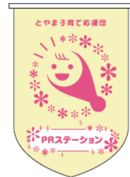
PRステーションフラッグ