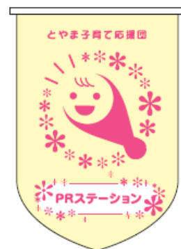
PRステーションフラッグ