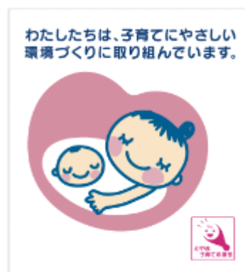
お出かけサポートステッカー

登録された店舗等へは、シンボルマークの入った店頭表示用ステッカー（⇒）を交付いたします。